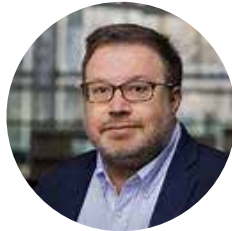
Manuel Barreiro-de-Acosta Hospital Universitario de Santiago. España