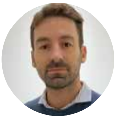
Martin Yantorno Hospital San Martín de La Plata. Argentina