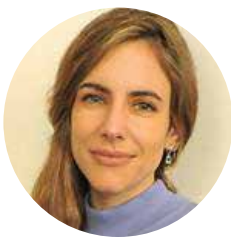
Beatriz Gros Hospital Clínico Reina Sofía. España