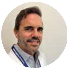
Ignacio Zubiaurre Hospital Británico. Argentina