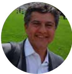
Anibal Gil Hospital Bonorino Udaondo. Argentina