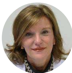
Pilar Nos Hospital Universitario La Fé. España