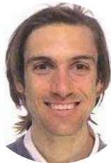
Gianluca Pellino Hospital Vall D´Hebron. España